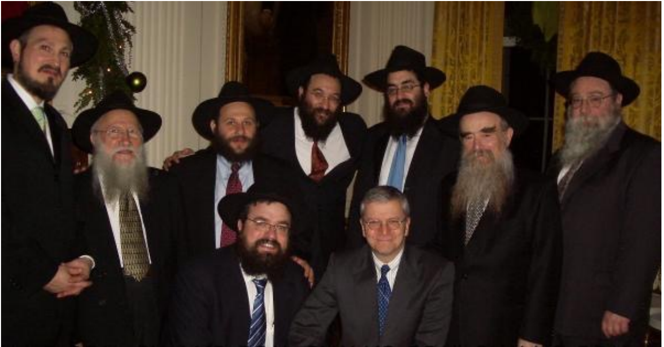
Joshua Bolten, Capo di stato maggiore.

anniversario dell'incursione in Polonia nel 2009, la Merkel si è scusata pubblicamente e ha incolpato la Germania per aver iniziato la seconda guerra mondiale quando l'ebraismo internazionale ha gettato i semi di questa guerra nel 1933 incitando l'America e l'Europa a boicottare le merci tedesche.