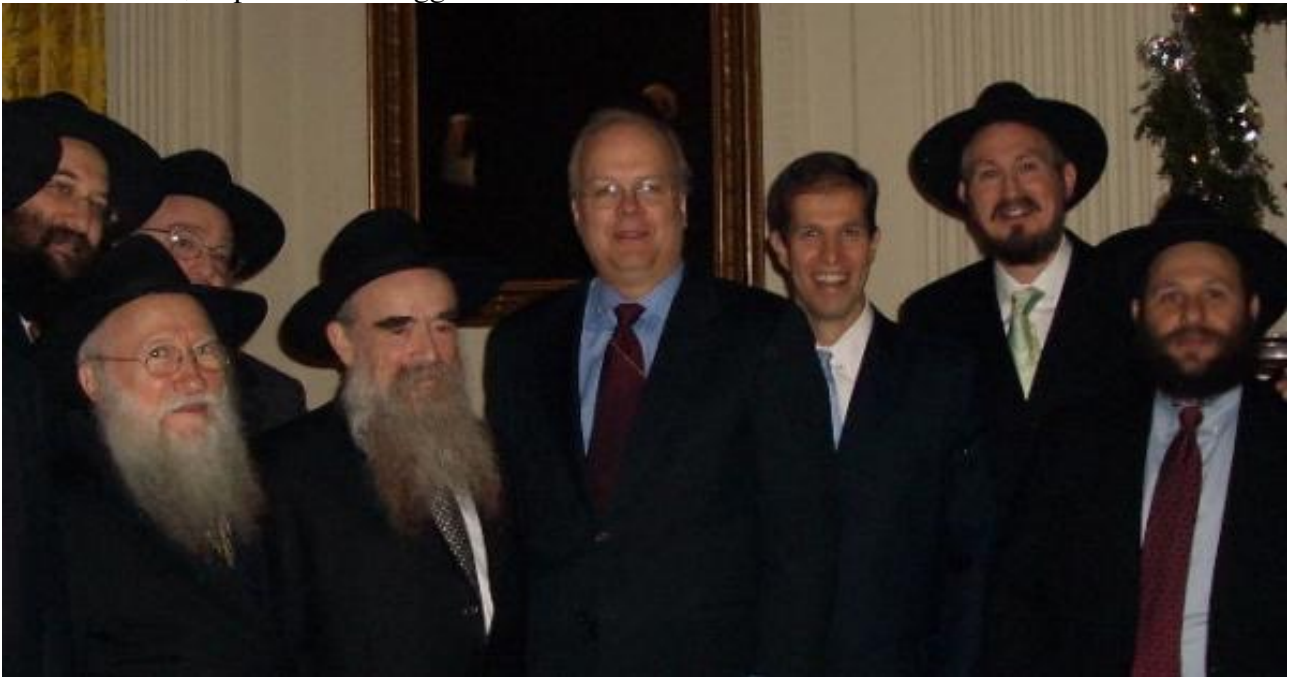
Karl Rove Vice Capo di Stato Maggiore. Circondato dai suoi capi ebrei.